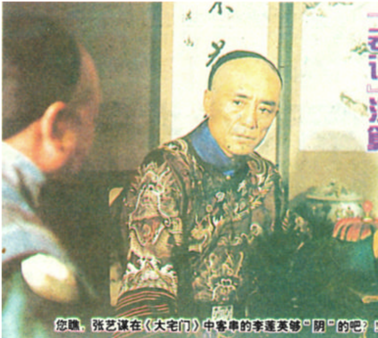
您瞧，张艺谋在《大宅门》中客串的李雁英够“阴”的吧！

本没有、也未打算出这什么东西，他们看了有关报道，正为此事恼火呢。杨可说，曾有人与他们联系，要办这样一本恐怖杂志，但他们拒绝了。 记者随后电话采访了云南省新闻出版局，该局报刊处一位负责同志马女士说：他们先是在北京市场发现了格调低下的假冒《时代风采》杂志，然后发现有媒体在炒作《夜故事》。马女士称，《时代风采》是有统一刊号(CN 53-1036)的正式出版物，他们从没有在新闻出版部门注册登记过《夜故事》，可以肯定地说，《夜故事》属非法出版物无疑。 (据《文汇报》)